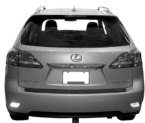
Lexus RX 350 and RX 450h